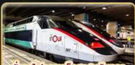
นั่งรถไฟความเร็วสูง 2 เส้นทาง PARIS - LYON & VENICE - ROME

📅 เดินทาง : 11-20 ก.พ. 68 / 15-24 มี.ค. 68 05-14 เม.ย. 68 / 29-08 พ.ค. 68