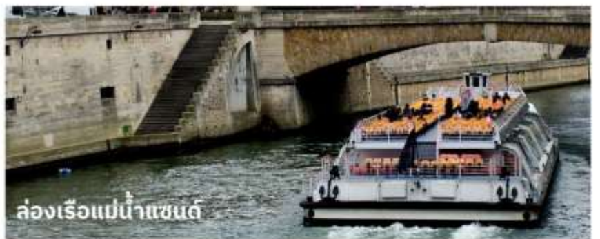
ล่องเรือแม่น้ำแซน

จากนั้นนำท่าน ล่องเรือบาโตมุช (Bateaux Mouches River Cruise) เรือล่องไปตามแม่น้ำแซน ที่ไหลผ่านใจกลางกรุงปารีส ชมความสวยงามของสถาปัตยกรรมอันคลาสสิกของอาคารต่างๆ