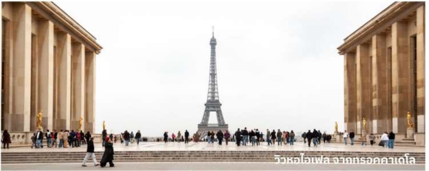
วิวหอไอเฟล จากทรอคคาเดโร