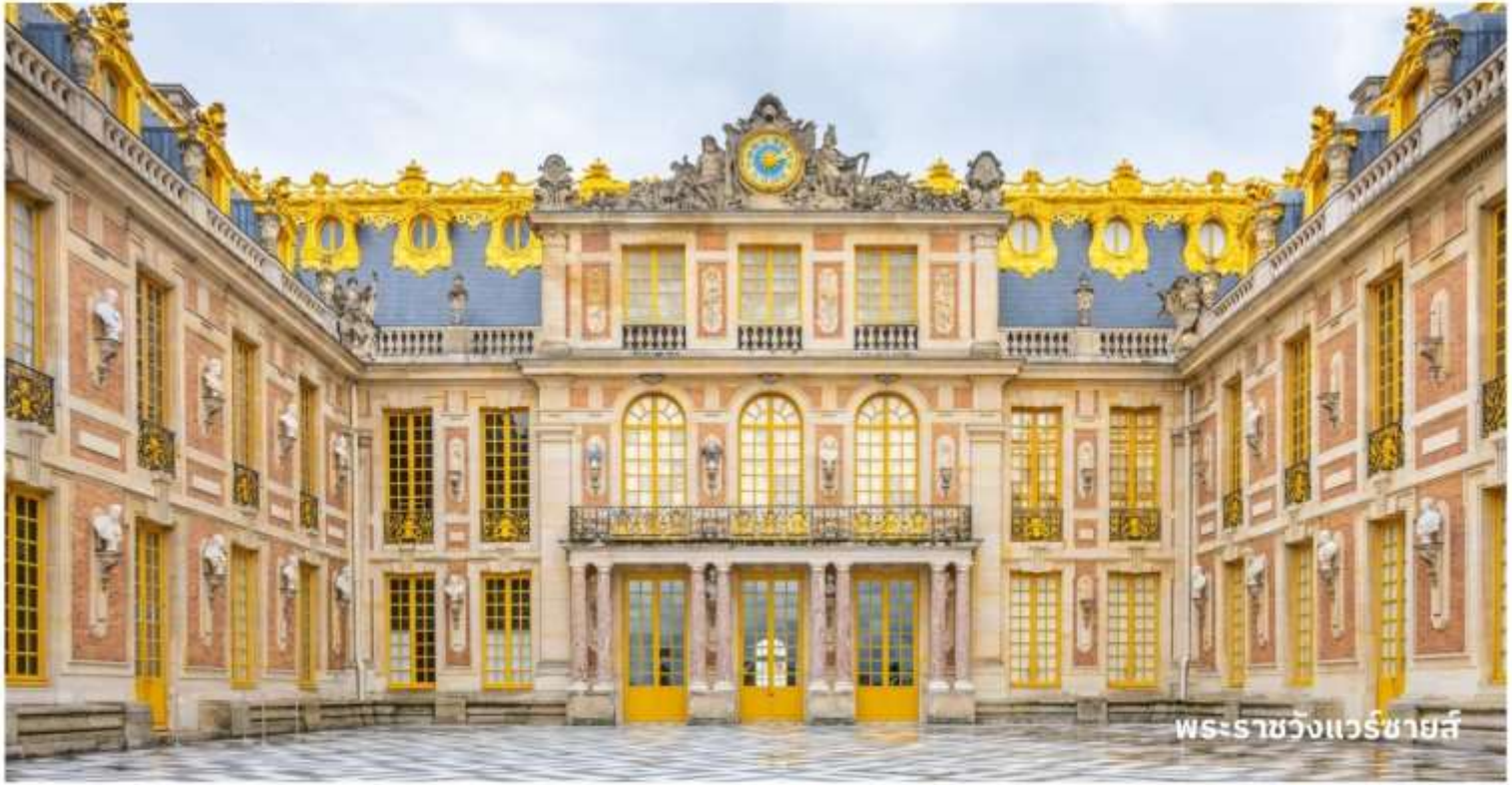
พระราชวังแวร์ซายส์

จากนั้นนำท่าน เข้าชมพระราชวังแวร์ซายส์ เป็นสถานที่ท่องเที่ยวที่มีชื่อเสียงมากที่สุดของประเทศฝรั่งเศส ตั้งอยู่ทางทิศตะวันตกเฉียงใต้ของปารีส ณ เมืองแวร์ซายส์ นับเป็นพระราชวังวังที่มีความยิ่งใหญ่และงดงามอลังการมากจนติดหนึ่งในเจ็ดสิ่งมหัศจรรย์ของโลก อีกทั้งยังได้รับการขึ้นทะเบียนให้เป็นมรดกทางวัฒนธรรม พระราชวังสร้างในรูปแบบสถาปัตยกรรมสไตล์คริสต์ศตวรรษที่ 17 และ 18