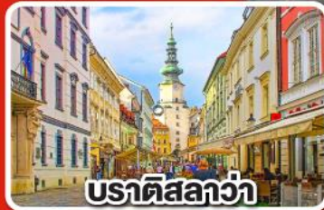
ปราติสลาวา

เที่ยวเมือง คาร์โลวารี เมืองแห่งสปา พร้อมเมนูพิเศษเปิดโบฮีเมีย