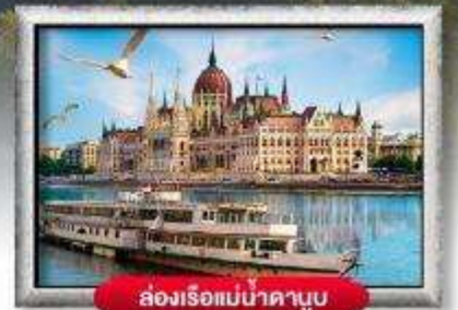
ล่องเรือแม่น้ำดานูบ

พิเศษ!! ลิ้มลองเมนูประจำชาติ ทั้ง 5 ประเทศ!!!