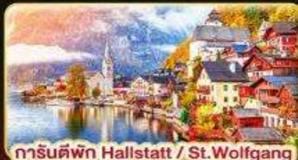
การ์นต์พิก Hallstatt / St. Wolfgang หรือรับทะเลสาบ 1 คืน