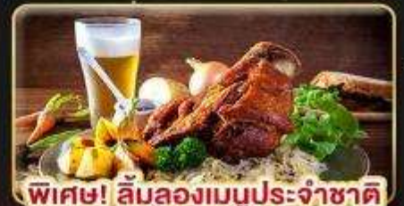
พิเศษ! ลิ้มลองเมนูประจำชาติ ทั้ง 5 ประเทศ!!!