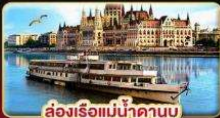
ล่องเรือแม่น้ำดานูบ พร้อมจิบแชมเปญ