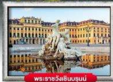
พระราชวังเซ็นบรุนน์