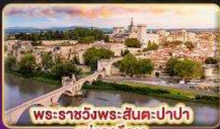
พระราชวังพระสันตะปาปา แห่งอเวียง