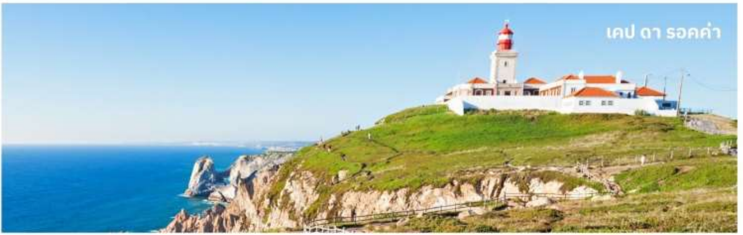
เคป ดา รอค่า