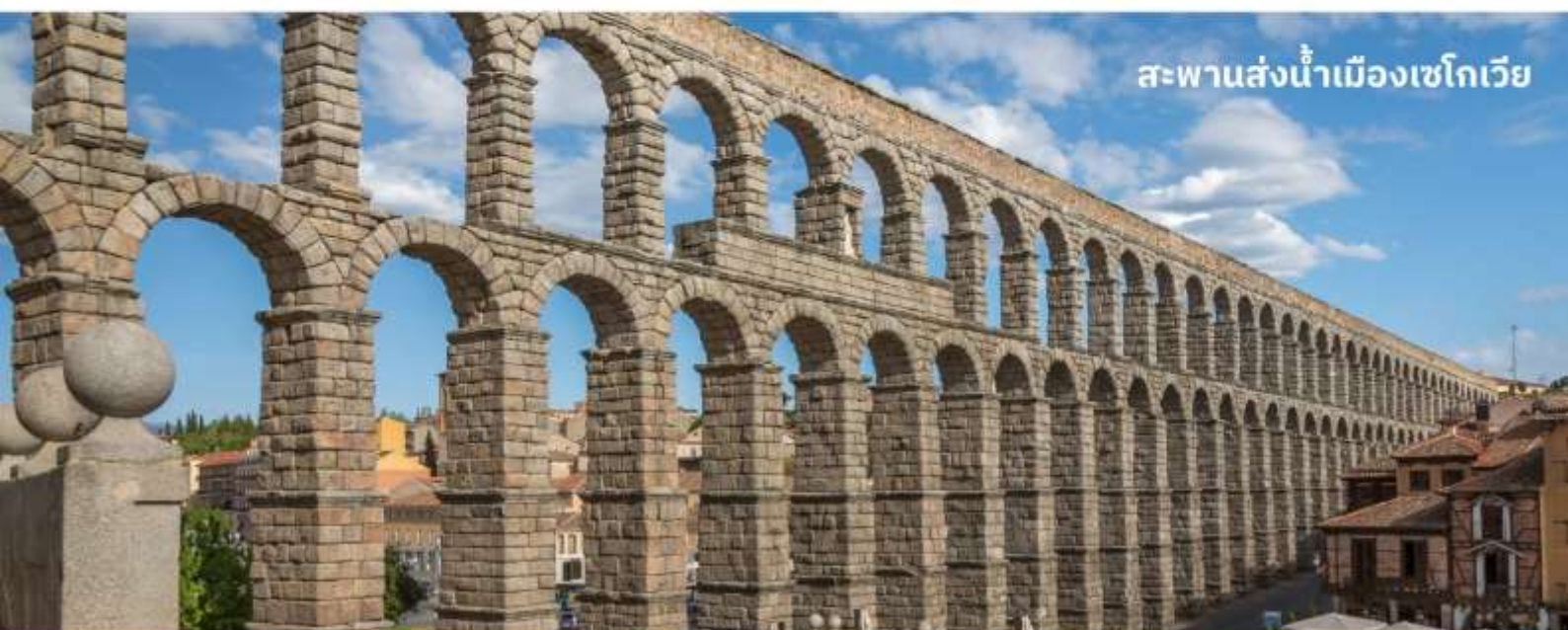
สะพานส่งน้ำเมืองเซโกเวีย

จากนั้นนำท่านสู่ นำท่านเดินทางสู่ Las Rozas Village Outlet ใช้เวลาเดินทางประมาณ 1.30 ชั่วโมง อิสระให้ท่านได้เดินเล่นเลือกซื้อสินค้ามีกว่าร้อยร้านค้า อาทิ เช่น Amani, Barbour, Coach, Diesel, Furla, Onisuka Tiger, Polo Ralph Lauren, Hugo Boss, Samsonite, Camper, Burbury, Superdry, Tag Heuer, Bvlgari, Calvin Klein ฯลฯ