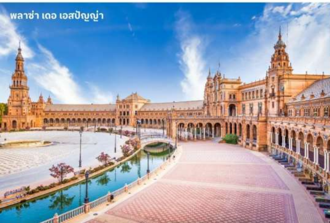
พลาซ่า เดอ เอสปันญ่า

จากนั้นนำท่าน เข้าชมด้านในมหาวิหารแห่งเซวิลญา (seville cathedral) วิหารแห่งเมืองเซวิลญา มีขนาดใหญ่เป็นอันดับ 3 รองจากมหาวิหารเซนต์ปีเตอร์ที่กรุงโรม และเซนต์ปอลที่ลอนดอน และใหญ่ที่สุดในสเปนสร้างด้วยศิลปะแบบโกธิค ภายในตกแต่งได้อย่างงามวิจิตร สร้างขึ้นแทนที่ตั้งของสุเหร่าเดิม โดยต้องการให้ยิ่งใหญ่แบบไม่มีใครเทียบเทียมได้ ในห้องเก็บทรัพย์สมบัติล้ำค่า มีทั้งภาพเขียน, เครื่องใช้ในพิธีของศาสนาที่ทำมาจากทองคำและเงินล้วนแต่ประเมินค่ามิได้ อีกทั้งยังเป็นทีเก็บศพของโคลัมบัสอีกด้วย จากนั้นนำท่าน เข้าชมหอคอยยีรัลดา (giralda) ตึกทรงรูปสี่เหลี่ยมผืนผ้าสูง 93 เมตร ติดกันกับมหาวิหาร เป็นลานส้มและน้ำพุเพื่อใช้ในพิธีชำระร่างกายของอิสลามด้านหน้าเป็นลานกว้างมีปราสาทอัลคาซาร สถาปัตยกรรมที่ยังคงมีคราบเงาความบรรเจิดและความคิดสร้างสรรค์ของชาวมัวร์ในอดีตเคยเป็นพระราชวังของกษัตริย์สเปนมาก่อน