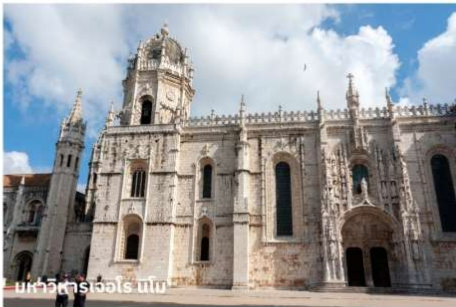
มหาวิหารเจโรนิโม

จากนั้นนำท่านบันทึกภาพกับ อนุสาวรีย์ดีสคัฟเวอรี สร้างขึ้นในปี ค.ศ. 1960 เพื่อฉลองการครบ 500 ปี แห่งการสิ้นพระชนม์ของ เจ้าชายเฮนรี่ เดอะเนวิเกเตอร์