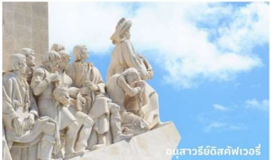
อนุสาวรีย์ดีสคัฟเวอรี