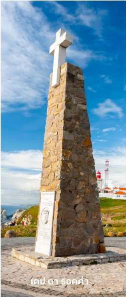
เคป ดา รอค่า

นำท่านชม เคป ดา รอค่า (Cabo da roca) อันเป็นแหลมที่ตั้งอยู่ปลายสุดทางทิศตะวันตกของทวีปยุโรป