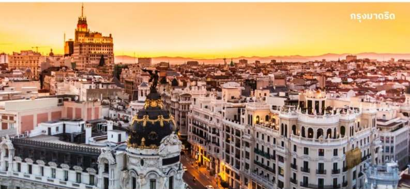
กรุงมาดริด

บริการอาหารกลางวัน ณ ภัตตาคาร จากนั้นนำเดินทางสู่ กรุงมาดริด เมืองหลวงของประเทศสเปน ใช้เวลาเดินทางประมาณ 5.30 ชั่วโมง ตั้งอยู่ใจกลางแหลมไอบีเรียน ในระดับความสูง 650 เมตร เป็นมหานครอันทันสมัยล้ำยุคที่กษัตริย์ฟิลลิปที่ 2 ได้ทรงย้ายที่ประทับจากเมืองโทเลโดมาที่นี่และประกาศให้มาดริดเป็นเมืองหลวงใหม่ ยกเว้นในช่วงประมาณปี ค.ศ. 1601-1607 เมื่อพระเจ้าฟิลลิปที่ 3 ได้ย้ายเมืองหลวงไปที่เมืองวัลลาโดลิด มาดริดได้ชื่อว่าเป็นเมืองหลวงที่สวยงามที่สุดแห่งหนึ่งในโลก และสูงสุดแห่งหนึ่งในยุโรป