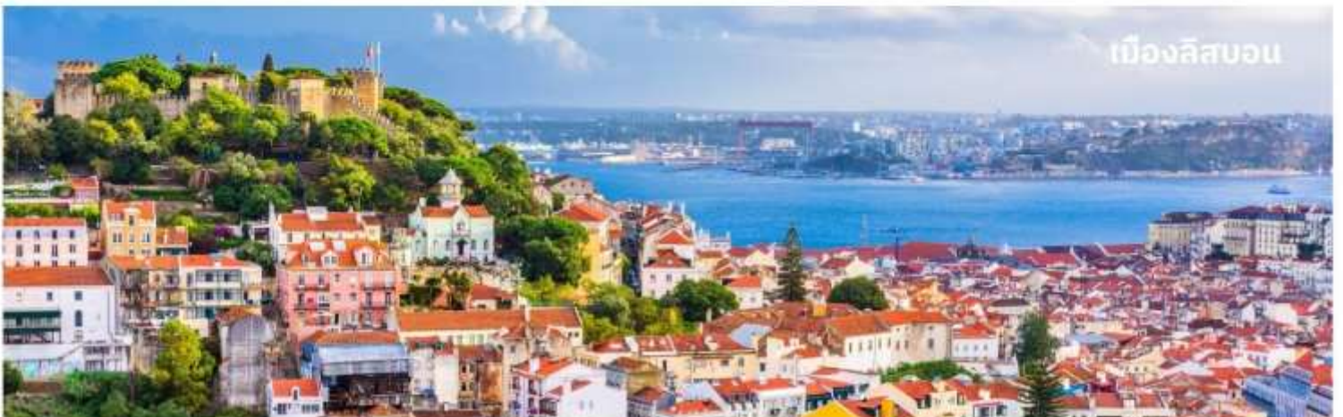
เมืองลิสบอน

นำท่านเข้าสู่ที่พัก Sana Metropolitan หรือเทียบเท่า