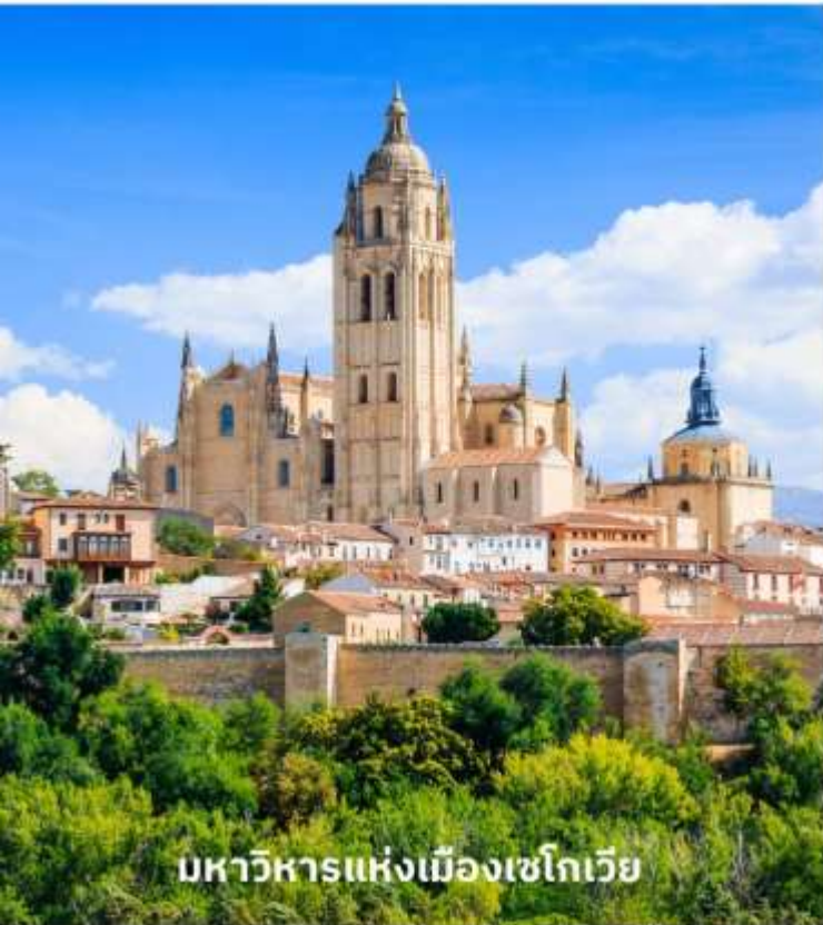
มหาวิหารแห่งเมืองเซโกเวีย