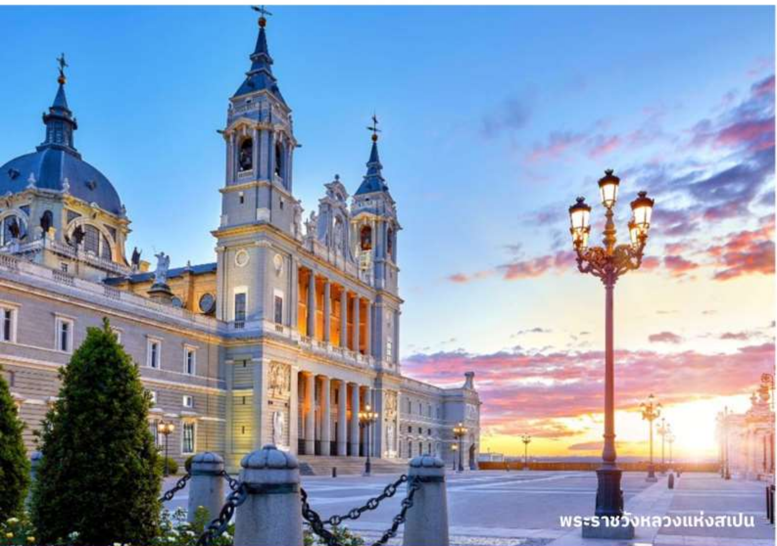
พระราชวังหลวงแห่งสเปน

จากนั้นนำท่านเข้าชม พระราชวังหลวงแห่งสเปน แห่งกษัตริย์ฮวน คาร์ลอส มีความสวยงามโอ้อ่า อลังการไม่แพ้พระราชวังอื่นๆ ในทวีปยุโรป เนื่องจากแนวความคิดเปรียบเทียบความใหญ่โตของพระ ราชวังแวร์ซายส์ และความสวยงามของพระราชวังลูฟว์ ในฝรั่งเศส ตั้งอยู่บนเนินเขาริมฝั่งแม่น้ำแมน ซานาเรส สร้างขึ้นในปี ค.ศ.1735 ใช้เวลาสร้างถึง 25 ปี ออกแบบโดยสถาปนิกชาวอิตาลีเลียน โดย การผสมผสานระหว่างศิลปะแบบฝรั่งเศสและอิตาลีเลียนประกอบด้วยห้องต่างๆ มากมายถึง 2,830 ห้อง (แต่เปิดให้เข้าชมเพียง12ห้อง) ซึ่งนอกจากจะมีการตกแต่งอย่างงดงามแล้ว ยังเป็นที่เก็บภาพ เขียนชิ้นสำคัญ ที่วาดโดยศิลปินในยุคนี้