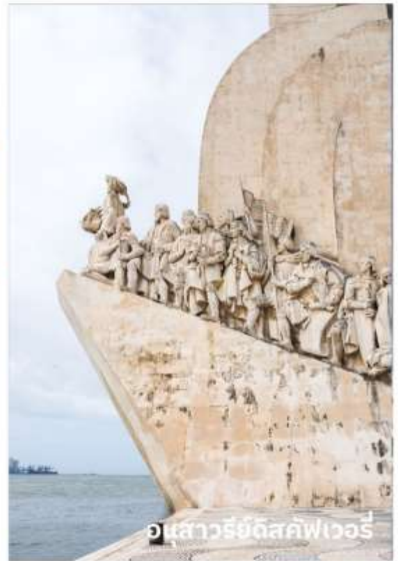
อนุสาวรีย์ดีสคัฟเวอรี