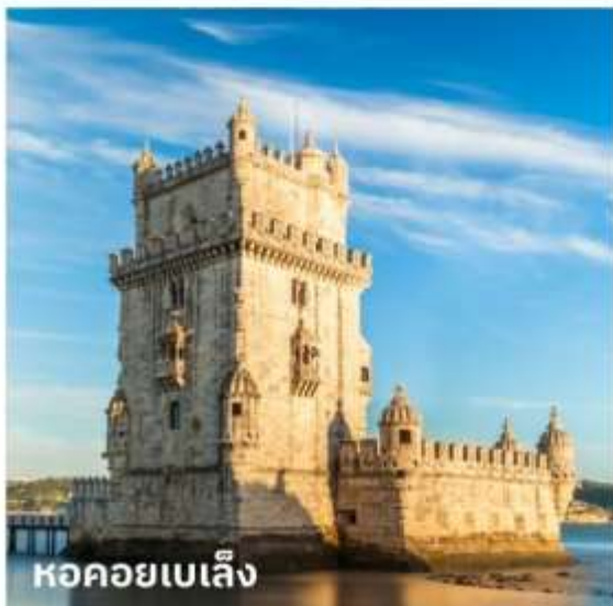
หอคอยเบเล็ง