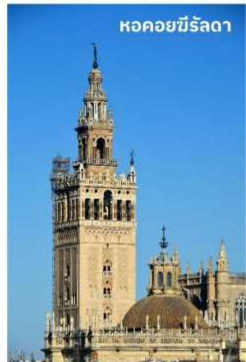
หอคอยยีรัลดา

หลังจากนั้นนำท่านเดินทางสู่ เมืองคอร์โดบา (Cordoba) ใช้เวลาเดินทางประมาณ 2 ชั่วโมง ครั้งหนึ่งเคยถูกครอบครองโดยชาวโรมันและชาวมัวร์จากอาหรับ เมืองคอร์โดบาตั้งอยู่ริมฝั่งแม่น้ำกัวดาลกีเบีย เป็นเมืองศูนย์กลางของวัฒนธรรมมุสลิมในประเทศสเปน องค์การยูเนสโกได้ประกาศให้เมืองคอร์โดบาเป็นเมืองมรดกโลกของประเทศสเปน เมืองนี้เป็นเมืองในระบบกาหลิบที่มีความเจริญรุ่งเรืองที่สุดของยุโรปในสมัยศตวรรษที่ 10 มีการสร้างมหาวิทยาลัยเน้นการเรียนรู้ด้านวรรณกรรม, วิทยาศาสตร์ ปรัชญาและการแพทย์