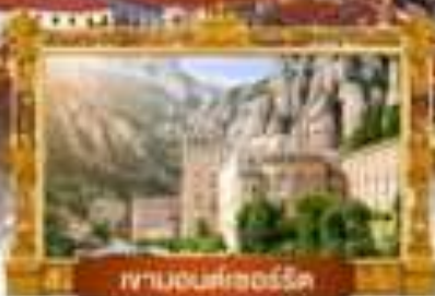
ซานเซบาสเตียน