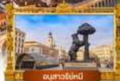
อนุสาวรีย์เมนี

เมนู พิเศษ! ข้าวผัดลูป + คุกกี้กับอิมเลียงชี