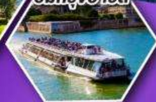
ล่องเรือบาโตมูซ ชมกรุงปารีส

เที่ยวเมืองวาตูซ เมืองหลวงของสาธารณรัฐ ลิกเทนสไตน์