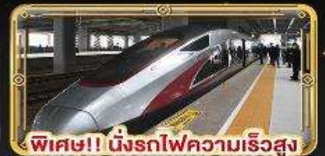
พิเศษ!! นิ่งรถไฟความเร็วสูง