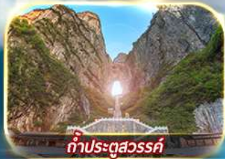
ทำประตูล้ำ