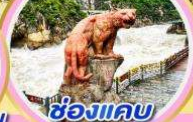
ช่องแคบ เสือกระโจน