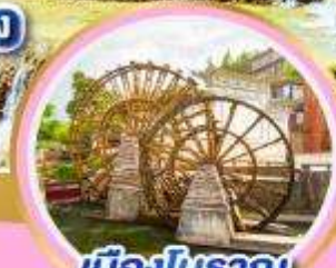
เมืองโบราณ ลี่เจียง