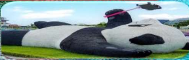
แพนด้าเซลฟี