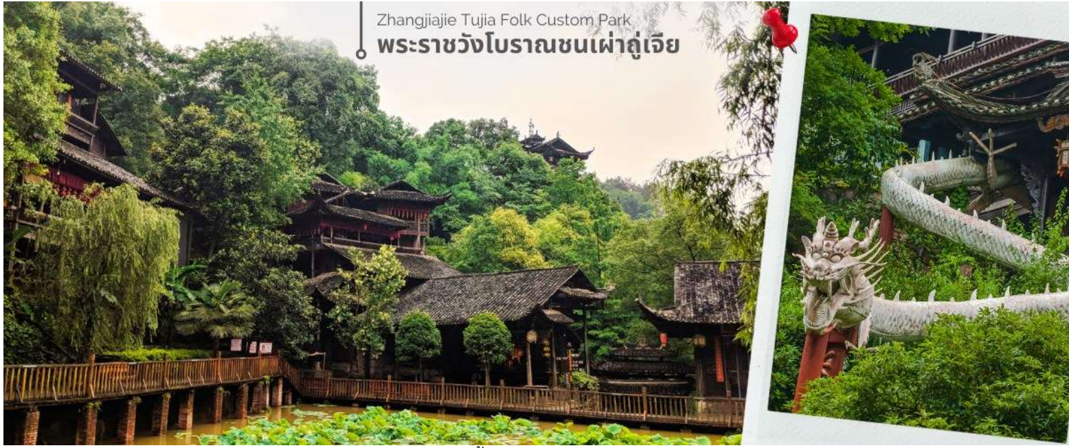
Zhangjiajie Tujia Folk Custom Park พระราชวังโบราณชนเผ่าถู่เจีย

จากนั้นนำท่านชม พระราชวังโบราณชนเผ่าถู่เจีย เป็นสถานที่ท่องเที่ยวที่มีชื่อเสียงของเมืองจางเจียเจีย ซึ่งชนเผ่าถู่เจีย หรือ ถู่เจียจู่ เป็นชาวจีนกลุ่มน้อยที่อาศัยอยู่ในเมืองจางเจียเจียมากที่สุด บริเวณภายในจะได้ชมวิถีชีวิตของชนเผ่าถู่เจีย พิธีสำคัญต่างๆ ข้าวของเครื่องใช้ การแสดงวัฒนธรรมทางด้านดนตรี ที่หาชมได้ยาก ภายในมีโชว์พื้นเมืองหลายโชว์แต่ที่ไม่เหมือนใครก็จะเป็นโชว์ สอนร้องไห้ก่อนการแต่งงาน ซึ่งจะต้องเข้าคอร์สกันเลยทีเดียว เพราะวันแต่งงานเจ้าสาวของเผ่านี้ต้องร้องไห้ 3 วัน 3 คืน เพื่อแสดงความอาลัยรักมียากจากบ้าน จากพ่อจากแม่ ไปอยู่ไกลๆที่บ้านสามี และยังมีโชว์อีกหลายโชว์ที่