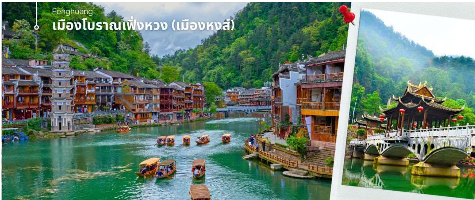
เป็นสัญลักษณ์ที่โดดเด่นของเมืองโบราณแห่งนี้

เมื่อเดินทางถึง เมืองโบราณเฟิงหวง เปลี่ยนเป็นรถของอุทยานเฟิงหวง นำท่าน นั่งเรือพายล่องแม่น้ำถั่วเจียง ชมบ้านเรือนโบราณห้อยยาสองฝั่งแม่น้ำถั่วเจียงอันเป็นเอกลักษณ์ของเมืองโบราณแห่งนี้ สัมผัสวิถีชีวิตที่ของชนเผ่าพื้นเมืองที่อาศัยอยู่บริเวณชุมชนนี้มาช้านาน เช่นชาวบ้านที่อาบน้ำ ซักผ้า หรือล้างผักอยู่ริมฝั่งแม่น้ำ บางครั้งท่านอาจได้เห็นชาวบ้านพายเรือไปร้องเพลงพื้นเมืองไป ช่างเป็นบรรยากาศที่สร้างมนต์เสน่ห์ดึงดูดผู้มาเยือน สำหรับชุมชนชนบทแห่งนี้เลยทีเดียวนะ ชมสะพานหงเฉียว สะพานไม้โบราณที่มีหลังคาคลุมเหมือนสะพานข้ามคลองในเวนิส สะพานแห่งนี้เคยเป็นด่านเก็บภาษีเกลือในสมัยราชวงศ์ซิง ซึ่งยังคงรักษารูปทรงในอดีตไม่เปลี่ยนแปลง ชมจัตุรัสหงส์ ที่มีรูปนกหงส์จำลองที่ทำจากทองเหลือง อัน