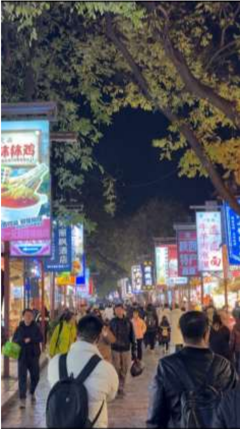
นำทุกท่านไป ถนนมุสลิม ( Muslim Quarter ) (ระยะทางประมาณ 500

เมตร ใช้เวลาเดินเท้าประมาณ 5 นาที) ย่านการค้าที่เต็มไปด้วยร้านอาหารและร้านค้าของชาวมุสลิม เป็นสถานที่ที่นักท่องเที่ยวสามารถสัมผัสวัฒนธรรมและชิมอาหารพื้นเมืองได้