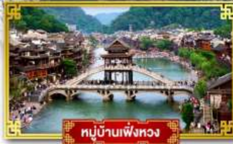
หมู่บ้านเฟิ่งหวง