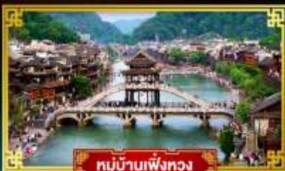
หมู่บ้านเฟิ่งหวง

สุดคุ้ม!! พักหรู 5 ดาว ทุกคืน เที่ยว 2 เมืองโบราณแดนมังกร