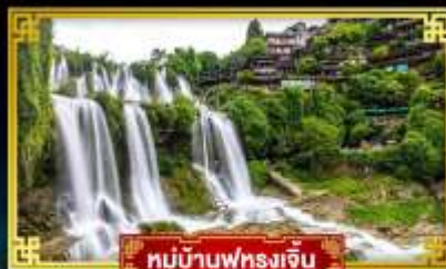
หมู่บ้านฟุทงเจี้ยน