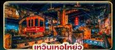
เทียนเหมินซาน