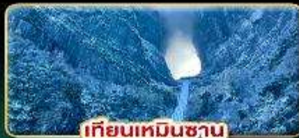
เทียนเหมินซาน