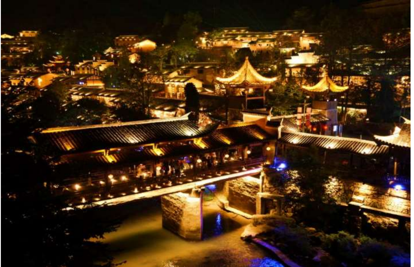
เย็น รับประทานอาหารเย็น ณ ร้านอาหารภายในหมู่บ้านเวดดา ที่พัก Shangrao Wangcao Hotel ระดับ 5 ดาว++ หรือเทียบเท่า (โรงแรมมาตรฐานจีน)