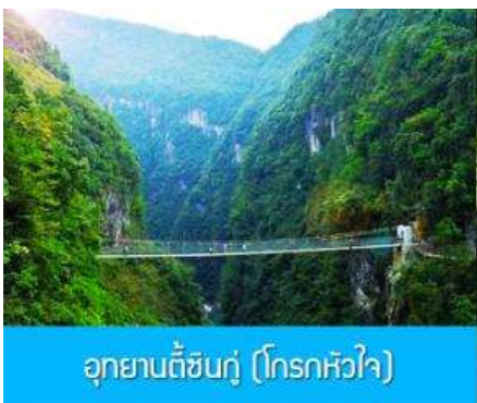
อุทยานตีซันกู่ (โกรทหัวใจ)

พักที่ โรงแรม ENSHI XIPU HOTEL ระดับ 4 ดาวท้องถิ่นหรือเทียบเท่าในเมืองเียนซือ