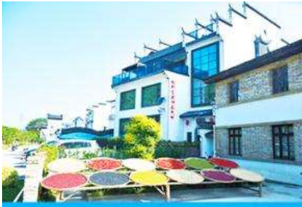
หมู่บ้านโบราณ สือเหมินซุน