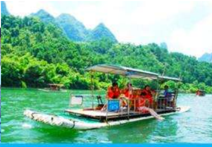
ล่องแพไม้ไผ่