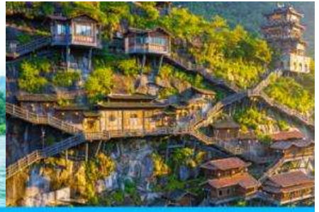
อุทยาน วังเซียนกู่

วันที่ 1 เมืองวู่หยวน-หมู่บ้านโบราณเหยียนสือเหมินซุน-ล่องแพไม้ไผ่ - เมืองซังเหรา - หุบเขาเทวดาวังเซียนกู่