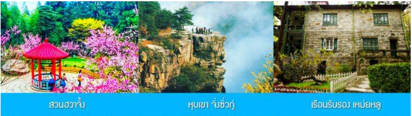
สวนฮวาจิ้ง