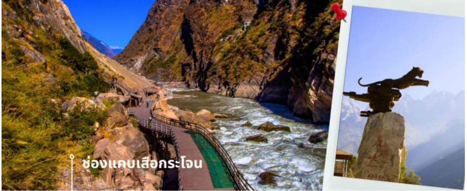
ช่องแคบเสื่อกระโจน

นำท่านแวะชม ช่องแคบเสื่อกระโจน (รวมค่าบริการบันไดเลื่อน ขึ้น-ลง) ซึ่งเป็นช่องแคบช่วงแม่น้ำแยงซีไหลลงมาจากจินซาเจียง(แม่น้ำทรายทอง) เป็นช่องแคบที่มีน้ำไหลเชี่ยวมาก ช่วงที่แคบที่สุดประมาณ 30 เมตร ตามตำนานเล่าว่า ในอดีตช่องแคบนี้สามารถกระโดดข้ามไปยังฝั่งตรงข้ามได้ จึงเป็นที่มาของ “ช่องแคบเสื่อกระโจน” ช่องแคบเสื่อกระโจนเป็นหนึ่งในหุบเขาเหนือแม่น้ำที่ลึกที่สุดในโลก โดยมีจุดที่ลึกที่สุดระหว่างแม่น้ำถึงยอดเขาประมาณ 3,790 เมตร บริเวณนี้มีผู้อยู่อาศัยเพียงเล็กน้อย ส่วนใหญ่เป็นชนพื้นเมืองชาวหน่าซี โดยจะอาศัยอยู่ในหมู่บ้านเล็ก ๆ บริเวณใกล้เคียง และหาเลี้ยง