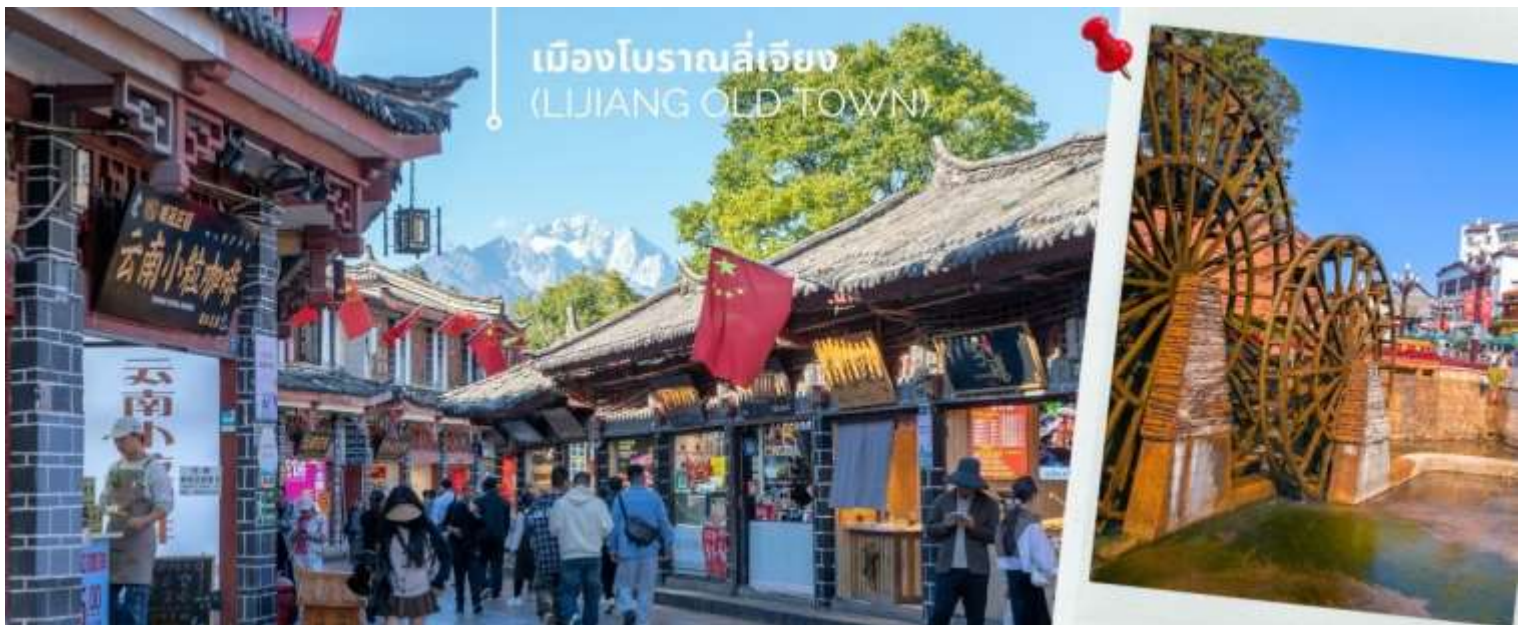
เมืองโบราณลี่เจียง (LIJIANG OLD TOWN)

นำท่านเดินทางชม เมืองโบราณลี่เจียง (LIJIANG OLD TOWN) หรือ เมืองโบราณต้าเอี้ยนเจิ้น เมืองเก่าแก่อายุกว่า 800 ปี ซึ่งภายในเมืองเก่านี้ยังคงมีสถาปัตยกรรมบ้านเรือนสไตล์จีนเก่าแก่ที่หาชมได้ยาก และได้รับการอนุรักษ์ไว้เป็นอย่างดี บางหลังเหมือนโรงเตี๊ยมโบราณที่เคยเห็นตามหนังจีนย้อนยุค บ้านเรือนส่วนใหญ่ถูกปรับเปลี่ยนให้กลายมาเป็น