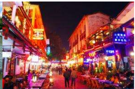
ถนนคนเดิน ซิเคียวหรือถนนฝรั่ง