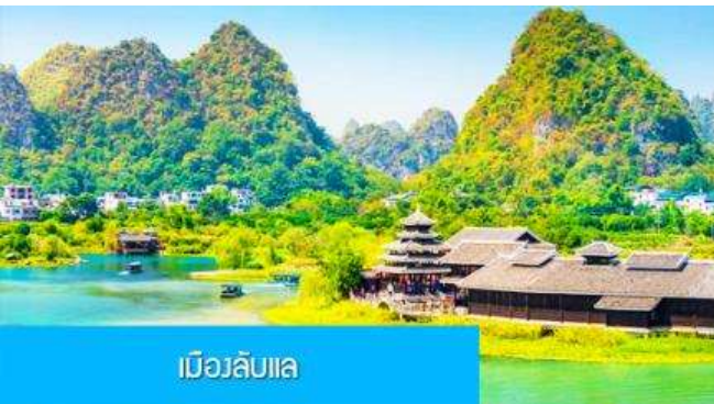
เมืองลิบแล