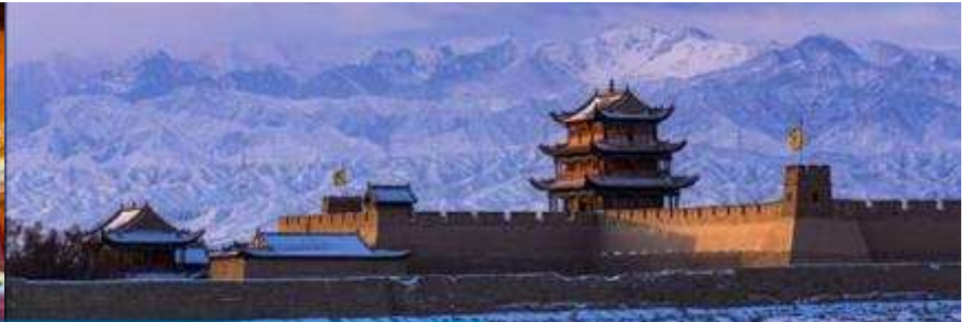
ด่านเจี๋ยวิ้วกวน

วันที่สาม เมืองจางเยี่ย – วัดพระใหญ่เมืองจางเยี่ย –เดินทางสู่เมืองเจี๋ยวิ้วกวน-ด่านเจี๋ยวิ้วกวน