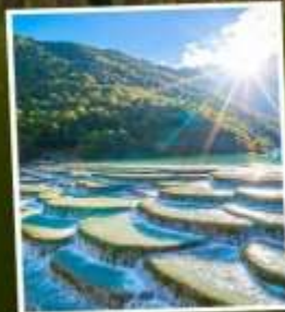
หุบเขาพระจันทร์สีน้ำเงิน