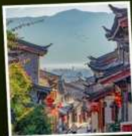
เมืองโบราณลี้เจียง