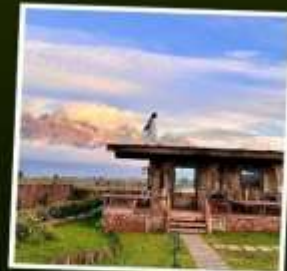
YUN DI AN CAFE