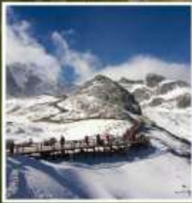
ภูเขาหิมะมังกรหยก