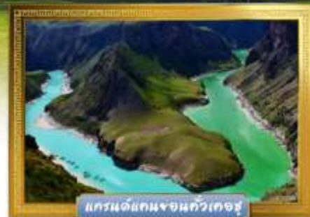
แกรนด์แคนยอนจันทูเคอซู

เดินทางโดย : สายการบินโซนาเซาเทิร์นแอร์ไลน์