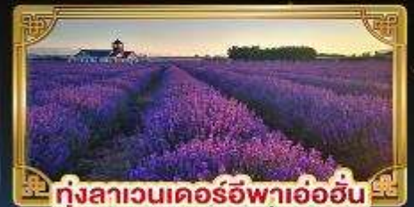
ทุ่งสาเวนเดอร์อีฟาเอ้อฮั่น