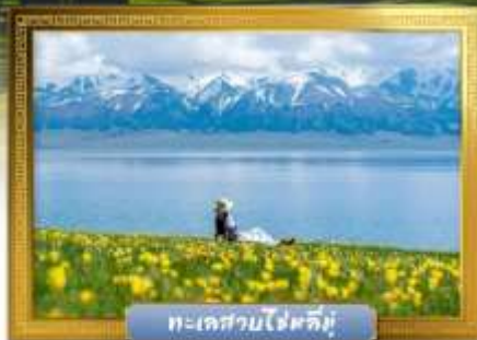
ทะเลสาบไซหลิมู่