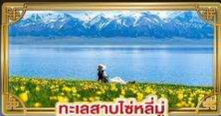
ทะเลสาบไซหลี่มู่