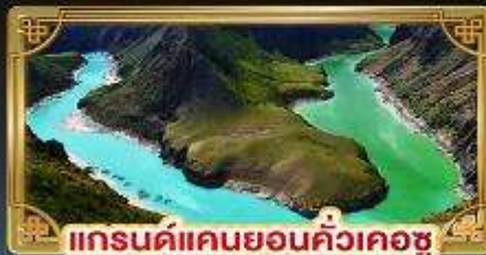
แกรนด์แคนยอนคั่วเคอซู