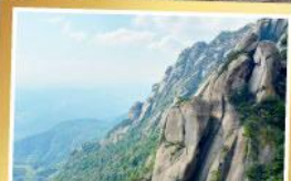
เทามิ่งซาน