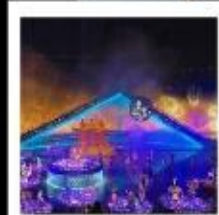
โซน ENCOUNTER WITH WUYUAN