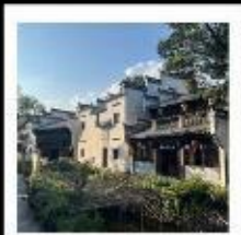
หมู่บ้านสุขุม่อช่างเหอ