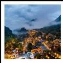
หุบเขาเทวดาฉางเฉียนถู่