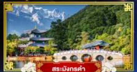
สระมิงกรคำ