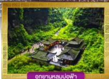
อุทยานหลุมบ่อฟ้า