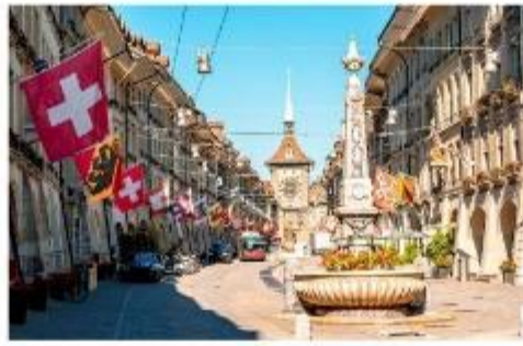
มาร์กาเซ ย่านเมืองเก่า

นำท่านชม บ่อหมีสีน้ำตาล สัตว์ที่เป็นสัญลักษณ์ของกรุงเบิร์น นำท่านชม มาร์กาเซ ย่านเมืองเก่า ปัจจุบันเต็มไปด้วยร้านดอกไม้และบูติก เป็นย่านที่ปลอดภัย จึงเหมาะกับการเดินเที่ยวชมอาคารเก่า อายุ 200-300 ปี นำท่านลัดเลาะชม ถนนจุงเคอร์นกาเซ ถนนที่มีระดับสูงสุดของเมืองนี้ ซึ่งเต็มไปด้วยร้านภาพวาดและร้านขายของเก่าในอาคารโบราณ ชม นวมฟาใช้ทคล็อคเค่นทรัม อายุ 800 ปี ที่มีโซวให้ดูทุกๆชั่วโมงในการตีบอกเวลาแต่ละครั้ง นวมฟานี้ ในช่วงปี ค.ศ. 1191-1256 ใช้เป็นประตูเมืองแห่งแรก ภายหลังได้ดัดแปลงใช้ทคล็อคเค่นทรัมให้กลายมาเป็นหอนวมฟาพร้อมติดตั้งนวมฟาดาราศาสตร์เข้าไป