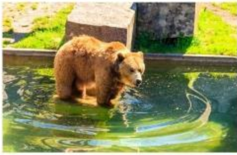
บ่อหมีสีน้ำตาล

เมืองหลวงของประเทศสวิตเซอร์แลนด์ เมืองโบราณเก่าแก่สร้างขึ้นเมื่อ 800 ปีที่แล้ว โดยมีแม่น้ำอาเร่ (Aare) ล้อมรอบตัวเมือง เสมือนเป็นป้อมปราการทางธรรมชาติไว้ 3 ด้าน นำท่านเที่ยวชมสถานที่สำคัญต่างๆในกรุงเบิร์น กรุงเบิร์นได้รับการยกย่องจากองค์การยูเนสโกให้เป็นเมืองมรดกโลก ในปี ค.ศ. 1863 นอกจากนี้เบิร์นยังถูกจัดอันดับอยู่ใน 1 ใน 10 ของเมืองที่มีคุณภาพชีวิตที่ดีที่สุดในโลก ในปี ค.ศ. 2010