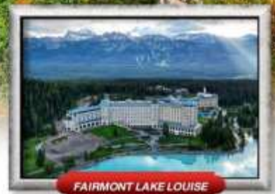
FAIRMONT LAKE LOUISE

บินทรู สายการบิน Full Service | เมนูพิเศษ! แคนาเดียนลิบสแตร์