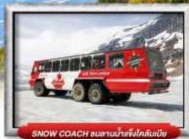
SNOW COACH ขนานน้ำแข็งใกล้หิมะ