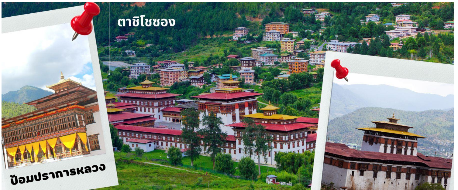
ตาซีโซซง

นำท่านเดินทางสู่ เมืองทิมพู เมืองหลวงของประเทศภูฏานตั้งแต่ปี ค.ศ. 1961 ใช้เวลาการเดินทางประมาณ 1 ชม. นำท่านเดินทางเข้าชม ตาซีโซซง มหาปราการแห่งศานาและวิหารหลวงแห่งเมืองทิมพู (วันธรรมดาเปิดหลัง 16.30น. / เสาร์-อาทิตย์ เปิดทั้งวัน) ตาซีโซซง หมายถึง ป้อมแห่งศาสนาอันเป็นมงคล สร้างในสมัยศตวรรษที่ 12 โดย ท่านซังตรง งามัง นัมเกล ปัจจุบันเป็นสถานที่ทำงานของพระมหากษัตริย์ สถานที่ทำการของกระทรวงต่างๆ และวัด รวมทั้งเป็นพระราชวังฤดูร้อนของพระสังฆราช และบริเวณอันใกล้ท่านจะได้เห็นวังที่ประทับส่วนพระองค์ของพระราชาธิบดี จิกมี ด้อย