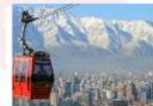
นั่งกระเช้าขึ้นสู่เนินเขาซานต้า ลูเซีย