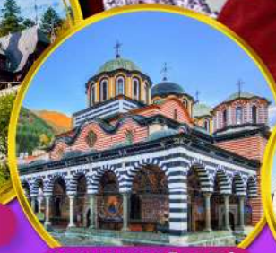
อารามมรดกโลกริลล่า