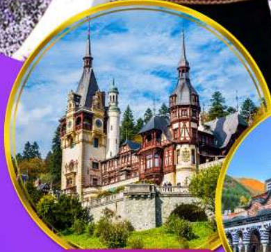
ปราสาทเปเลส