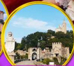
ป้อมชาเรเวทส์