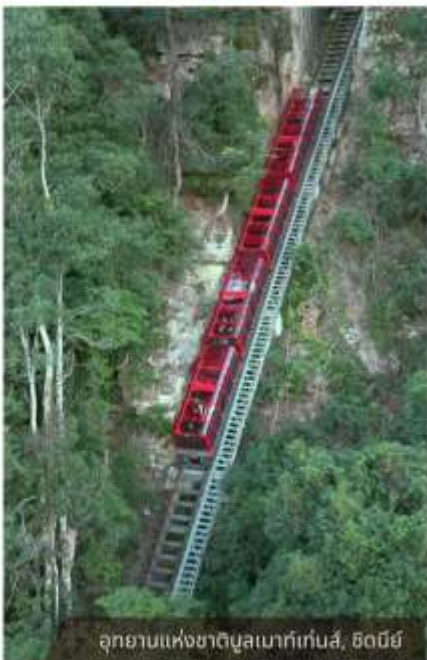
อุทยานแห่งชาติบลูเมาท์เท็นส์, ซิดนีย์