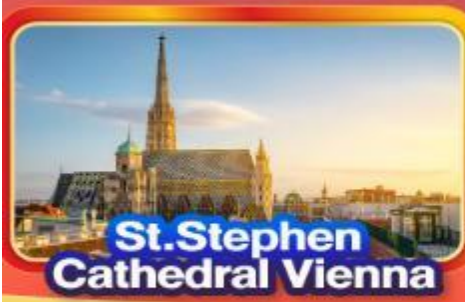
St. Stephen Cathedral Vienna