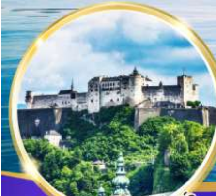
ปราสาทไฮเซนซาลส์บวร์ก