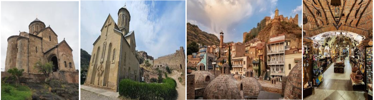
นำท่านเข้าสู่ที่พัก Iveria Inn Hotel หรือเทียบเท่า ★★★★★

วันที่ห้า เมืองทบิลีซี – วิหารจวารี – ป้อมอนานูรี – เมือง Pasaunuri – เมือง Stepansminda – โบสถ์เกอร์เกดี Russian-Georgian Friendship Monument – เมืองคูตาอูรี