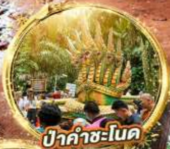
ป่าคำชะโนด