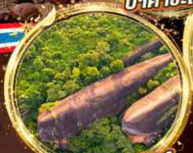
หินสามวาฬ