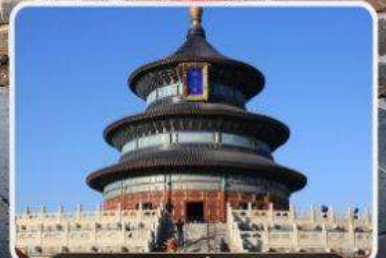
หอบูชาเทียนถาน